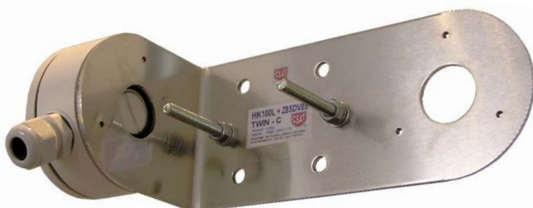
DS-1280ZJ-XS + HIK100L TWIN-C + Z85DV85