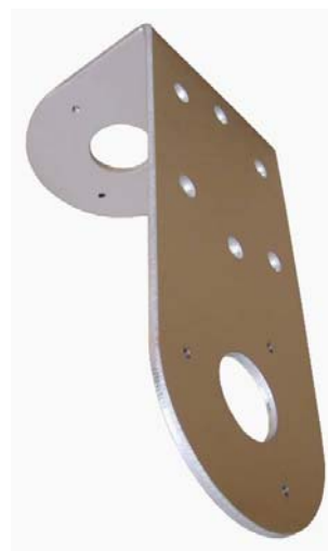
plech ( telo držiaka ) HIK100L TWIN-C